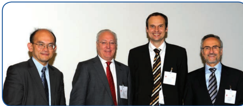
Die wissenschaftlichen Leiter der AFNET/EHRA Konsensuskonferenz: G. Lip, J. Camm, P. Kirchhof, G. Breithardt